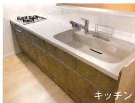
※写真は当社施工写真※完成予定イメージ

●所在地:豊中市曾根南町2丁目14-18 ●阪急宝塚線「曾根」駅 徒歩10分 ●土地・建物セット価格:3,180万円(税込) ●土地面積:79.76㎡ (私道負担含む) ●構造/木造3階建 ●1階約34.89㎡ 2階約32.40㎡ 3階約32.97㎡ 合計約100.26㎡ ●建ぺい率 60% ●容積率200% ●駐車スペース:有 ●状況:未完成 ●引渡:相談 ●仲介