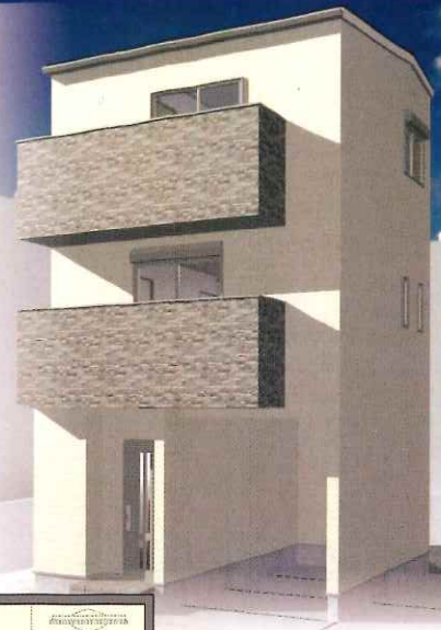
※完成予定イメージ